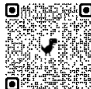
なんでも相談室受付フォーム